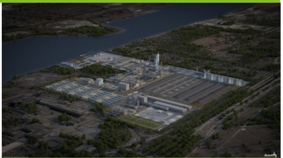
Illustration non contractuelle